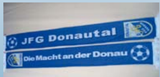
JFG-Schal ca. 160 cm x 18 cm Preis: 9,00 €