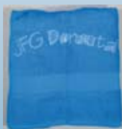
JFG-Badetuch ca. 135 cm x 65 cm Preis: 10,00 €