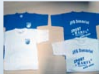
JFG-T-Shirt - weiß oder blau Gr. 152, 164, S, M, L, XL, XXL Preis: 5,00 €