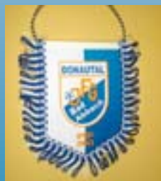
JFG-Autobanner ca. 6 cm x 8 cm Preis: 3,00 €