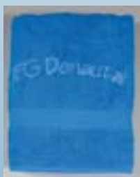
JFG-Handtuch ca. 100 cm x 50 cm Preis: 8,00 €