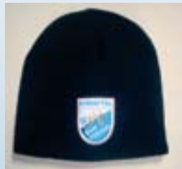
JFG-Mütze schwarz Preis: 7,50 €