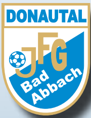
JFG-Aufkleber ca. 6 cm x 8 cm Preis: 0,50 €