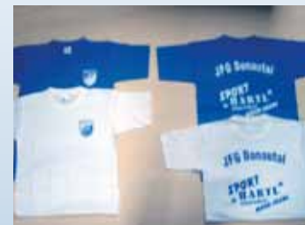
JFG-T-Shirt - weiß oder blau Gr. 152, 164, S, M, L, XL, XXL Preis: 5,00 €