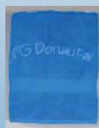
JFG-Handtuch ca. 100 cm 50 cm Preis: 8,00 €