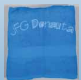
JFG-Badetuch ca. 135 cm x 65 cm Preis: 10,00 €