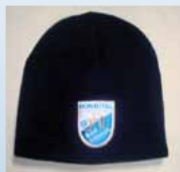
JFG-Mütze schwarz Preis: 7,50 €