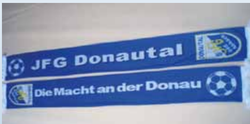
JFG-Schal ca. 160 cm x 18 cm Preis: 9,00 €