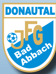
JFG-Aufkleber ca. 6 cm x 8 cm Preis: 0,50 €