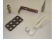
Ladeluftkühler für Audi A8 Einzelteile aus der mech. Fertigung