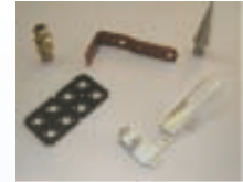
Ladeluftkühler für Audi A8 Einzelteile aus der mech. Fertigung