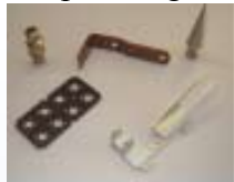
Ladeluftkühler für Audi A8 Einzelteile aus der mech. Fertigung